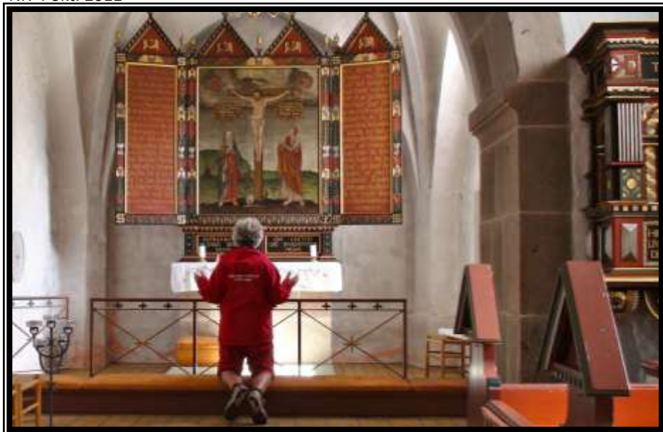
Moses i Ørum Kirke