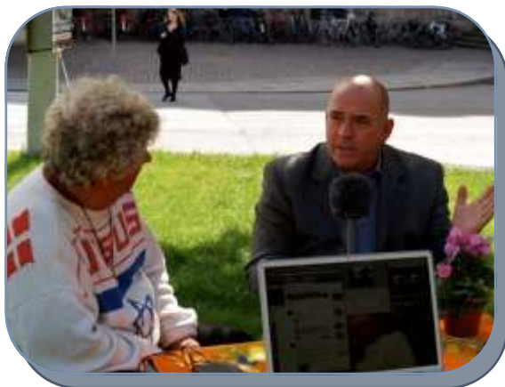
Moses interviewer Søren Espersen til webtv.

Det var også forfriskende at se Moses interviewe to folkevalgte politikere til webtv.