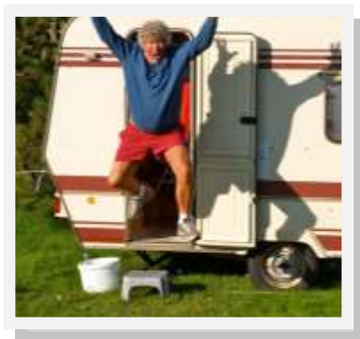
Sig så lige ”gammel” en gang til.

Jeg fornemmer, der bliver udgydt en speciel salvelse over de ældre mænd og kvinder i Kristi legeme. Gud er ikke færdig med at bruge dig. Din alder er ikke imod dig, men for dig!”