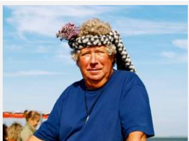
Man kan næsten blive som barn igen. Ugh store høvding.

Følg Åndens tilskyndelse. Salvelsen kommer til at vælte op inden dig, så du kan indtage bjerge, udføre nye bedrifter, vandre uden at trættes og løbe uden at mattes.