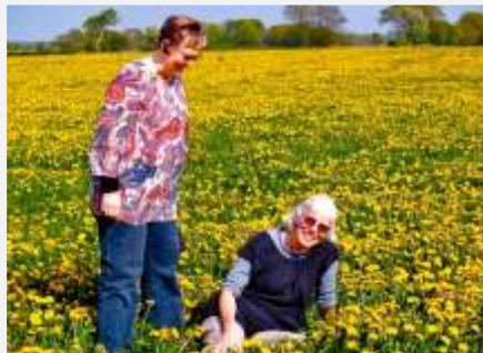
Et par af "De gamle"

Betyder det at "de gamle" spiller en sekundær rolle? Eller slet ingen rolle? Eller er de hensat til "kun" at leve i den skjulte forbønstjeneste?