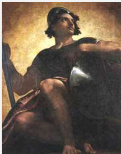
Måske har bodybuilderne lignet lidt Ærkeenglen Uriel.