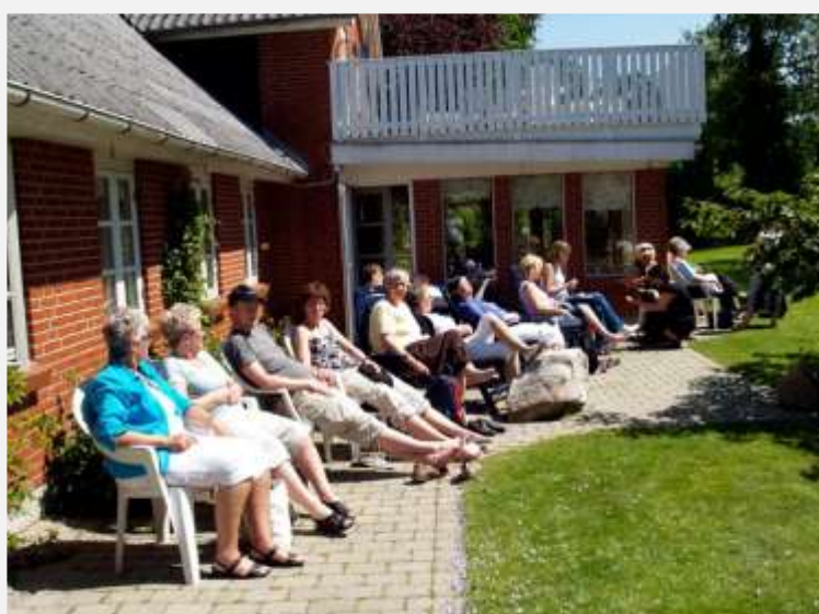
Hyggestund under et stævne på PH.

Husk at Pottemagerens Hus er stressfri zone, hvor også du kan få gavn af at tilbringe nogle dage i stilhed - og i skøn natur. Også